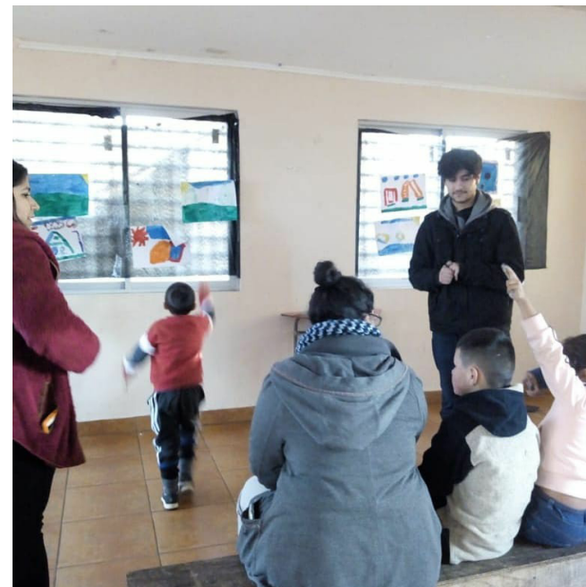
Comité de Infancia y Adolescencia, Villa Las Almendras