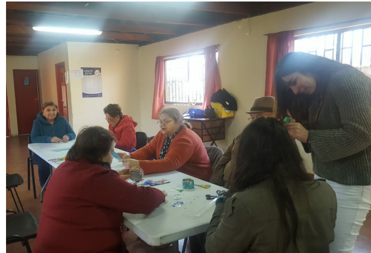
Grupo de adultos/as mayores Barrio Santa Rosa