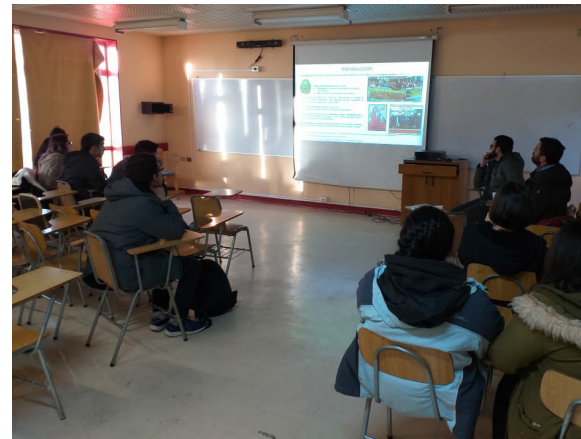
Ciclo Formativo Sentipensante del Grupo de Estudios Críticos