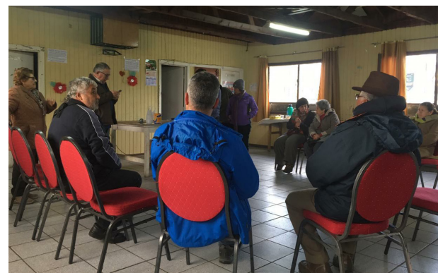
Reactivación grupo de adultos/as mayores Población Zañartu